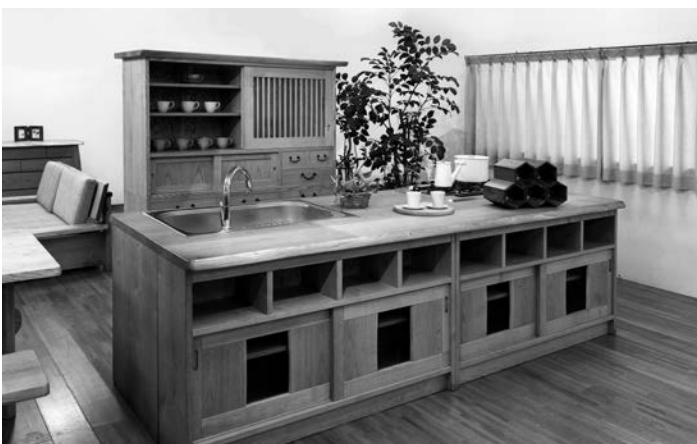
栗無垢材の水屋箆笥 W1500×D510×H1750mm