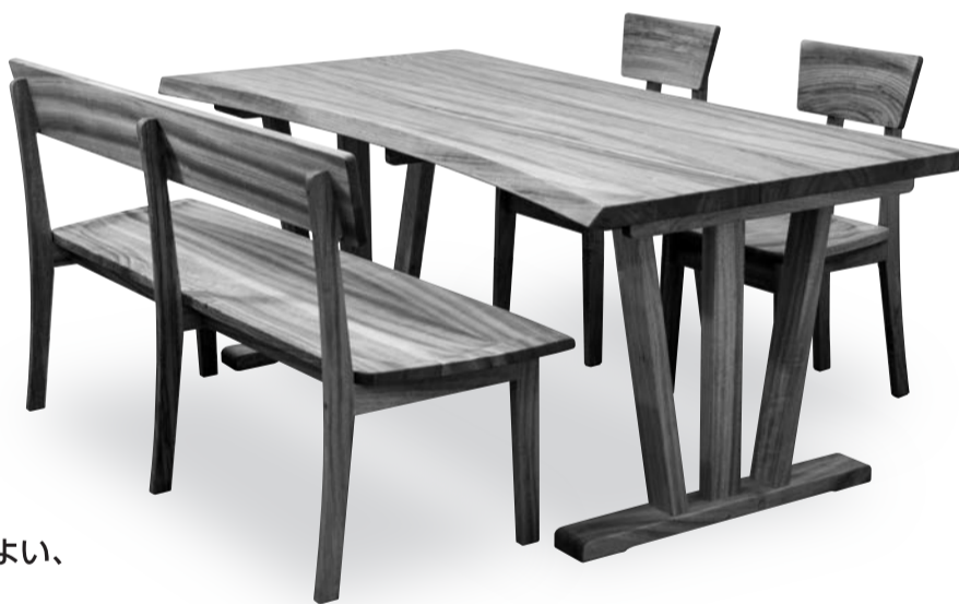
楠の優しい香りが心地よい、 ダイニングテーブル