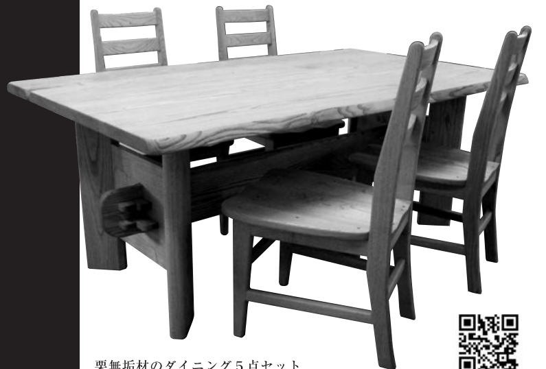
栗無垢材のダイニング5点セット テーブル：W1800×D900×H700mm チェア：W470×D500×H920(SH420)mm